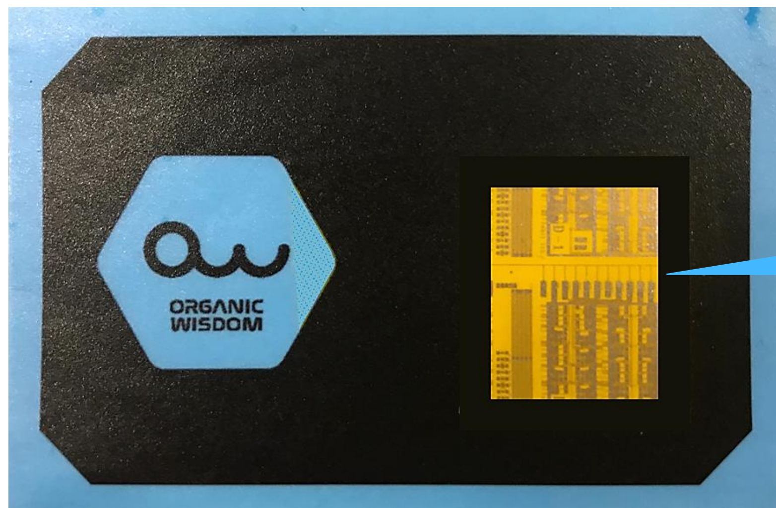
有機フィルム型タグ