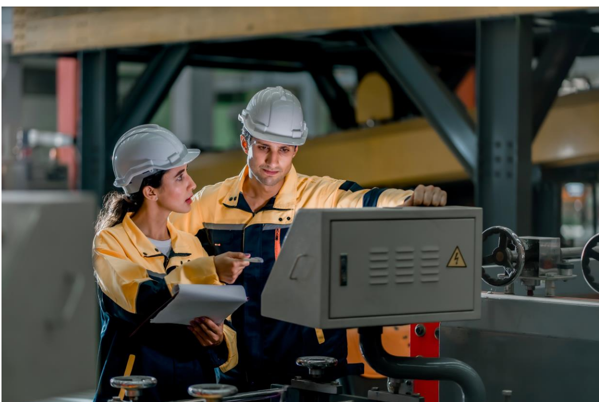
操作アシスト機能